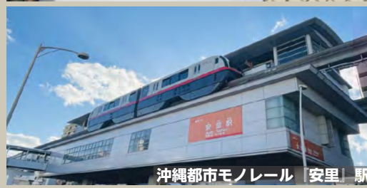
沖縄都市モノレール「安里」駅